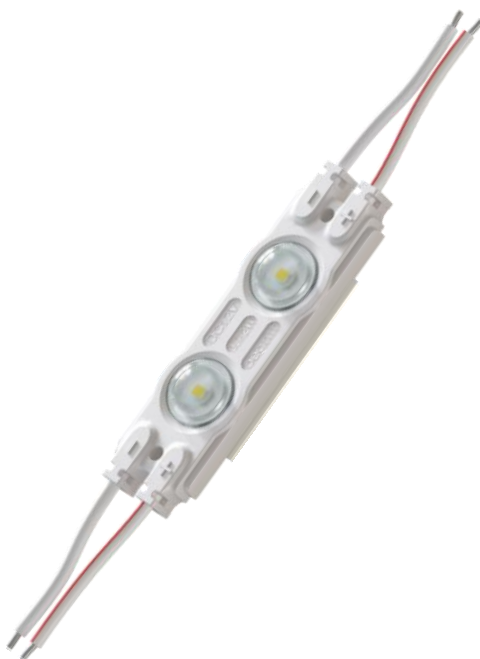
Рис.1 Внешний вид

BG-2SMD160W7500 0,72W 65lm 12V - герметичный светодиодный модуль в пластиковом корпусе. Широкая линза позволяет использовать модуль даже в конструкциях с малой глубиной. Алюминиевая печатная плата обеспечивает оптимальный температурный режим работы светодиодов. Модули соединены между собой по параллельной схеме в гирлянды по 20 штук. Используется при изготовлении элементов наружной и интерьерной рекламы, для светового оформления интерьера и ландшафтов.